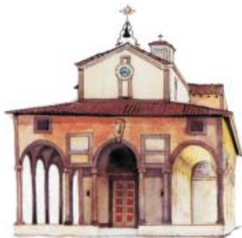
Santuario Madonna della Fontenuova

Nella seconda metà dell'Ottocento furono scoperte delle grotte termali dalle particolari proprietà terapeutiche di Grotta Giusti.