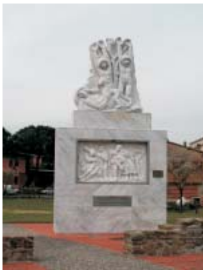
Monumento in ricordo dell'eccidio nel Padule

In breve si raggiunge il posteggio con area attrezzata del Centro Visite dove ci si può rivolgere per le visite guidate.