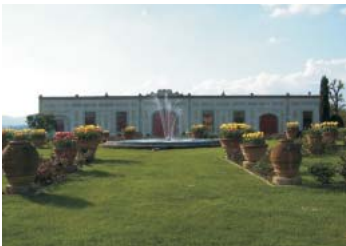
Villa La Morgia