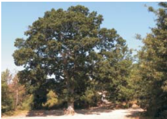
Il grande Leccio

A 14,3 Km la lunga e riposante discesa finisce al centro di Capraia in corrispondenza dello STOP che ci immette sullo stradone di collegamento Montelupo, Capraia, Limite.