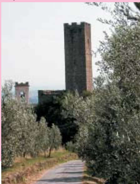
Il castello di Larciano

Da quel momento però l'importanza del castello iniziò a diminuire, sia perchè i confini da difendere si erano spostati, sia perchè le nuove tecniche di guerra basate sulla polvere da