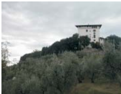
Villa Medicea a Montevettolini

A Km 39,5 (q 165), raggiunto l'ingresso della villa Medicea (Montevettolini sud), si prosegue dritti seguendo le mura fino alla deviazione per il centro di Montevettolini e attraverso via del Portone si torna al posteggio di partenza (Km 48,8 q 170).