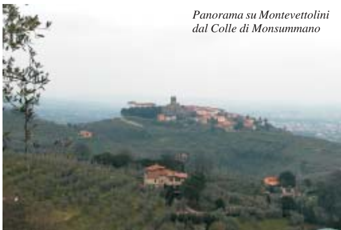
Panorama su Montevettolini dal Colle di Monsummano

Ancora un centinaio di metri in salita e una curva a tornante sulla sinistra, si raggiunge l'Oratorio Madonna della Neve (km 13,3 q 160). Seguendo la provinciale a dx e la deviazione ancora a dx per Montevettolini si ritorna a via del Portone (porta a nord del paese) e al posteggio di partenza (13,7 km q 170)