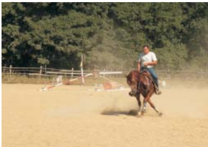
Esercitazioni in un maneggio sul Montalbano

Si prosegue lungo lo sterrato, ora in discesa più impegnativa, fino ad un ampio piazzale (9,2 km dalla partenza) con al centro un maestoso leccio dal quale partono cinque strade. Alcuni cartelli all'imbocco del piazzale ci danno la direzione: dobbiamo seguire lo sterrato in discesa che punta decisamente a sud (il secondo alla nostra dx, direzione Capraia).