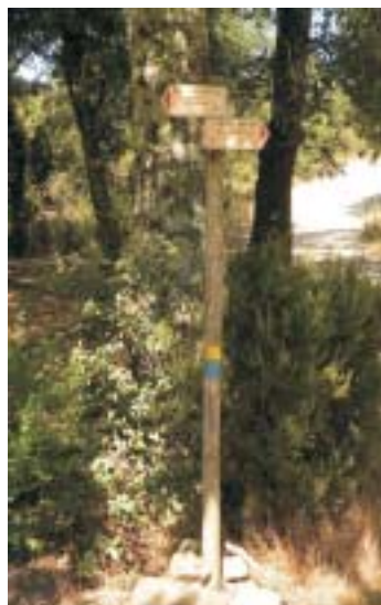
Bivio sopra Capraia

A 12,3 km finisce la boscaglia e ci troviamo nuovamente immersi in uliveti e vigneti. Poco più avanti, in corrispondenza di un residence con campi da tennis, inizia l'asfalto.