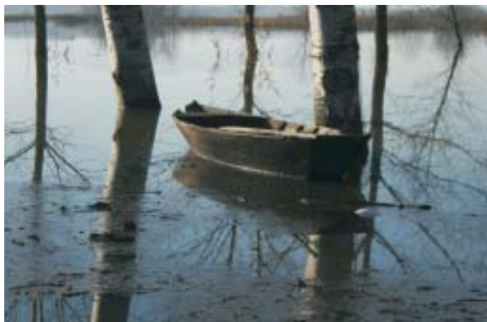
Nel cuore del Padule

Il Porto de Le Morette, che le carte del 1800 ci mostrano molto diverso dall'attuale, a differenza degli altri scali del Padule era una piccola darsena con gli argini sostenuti da muri di pietra, a testimonianza del notevole valore di questo approdo lungo le vie di navigazione. Nelle carte storiche del 1700 è già citato un "Porto delle Morette", identificabile nell'attuale omonimo porto, che fu costruito probabilmente per la perdita di agibilità di un Porto vecchio delle Morette situato più a nord.