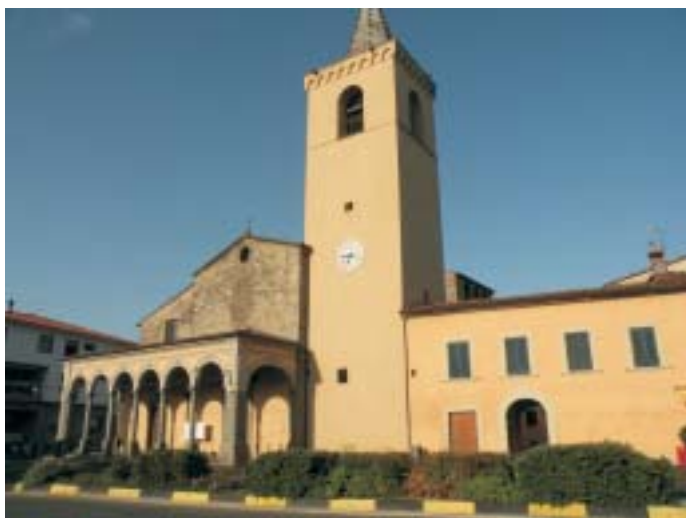
Pieve di Casalguidi

mediceo le lotte si attenuarono sino alla pacificazione imposta da Cosimo I ed all'istituzione delle podesterie in seguito alla quale Casalguidi divenne parte di Serravalle del cui comune costituisce tutt'oggi un polo di aggregazione demografica (si verifica il fatto curioso che i propri abitanti per recarsi al Municipio di residenza, devono attraversare un altro comune: Pistoia). Casalguidi con il suo toponimo è la più chiara testimonianza del predominio che nella zona ebbe la potente famiglia dei Guidi in epoca feudale. La parrocchia di S. Pietro, che cela le strutture della pieve romanica (XIII sec.), fu trasformata ed ampliata nel 1759.